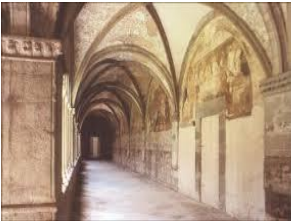
Chiostro del XIII secolo. Particolare