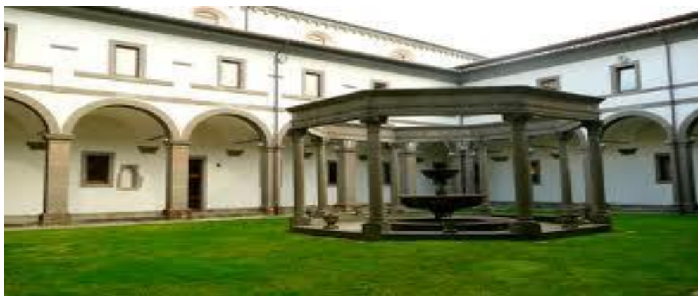
Chiostro Rinascimentale. Particolare