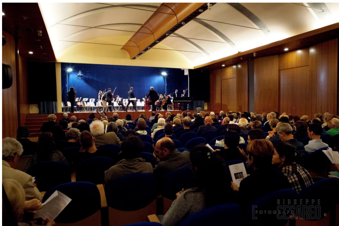
Auditorium di Santa Maria in Gradi