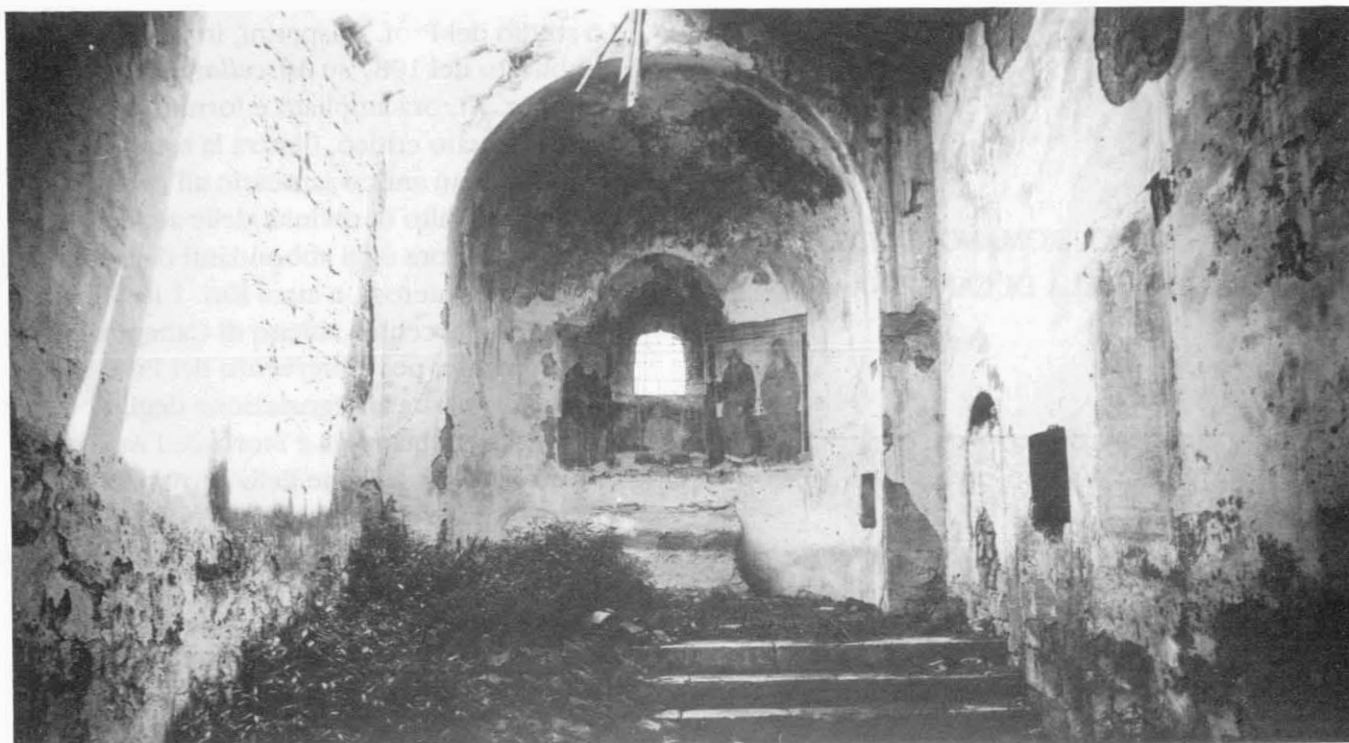
Graffignano - Chiesa di S. Leonardo: interno e rilevamento dell'iscrizione.