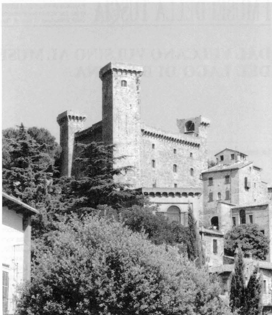
Bolsena, Rocca Monaldeschi della Cervara, sede del Museo Territoriale del Lago di Bolsena

Nella seconda metà dell'VIII secolo l'intera zona incentrata sul bacino del lago di Bolsena entrò a far parte