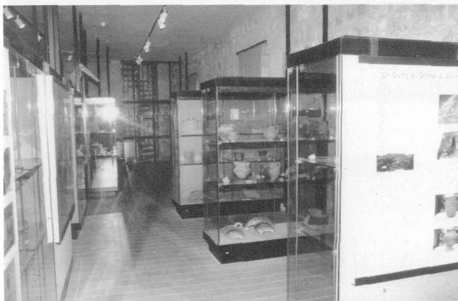
Museo Territoriale del Lago di Bolsena: sezione protostorica

Nel cortile più interno della Rocca, infine, è collocato il Lapidarium , dove sono raccolti altari funerari ed iscrizioni pubbliche romane recuperate nei dintorni di Bolsena. E la visita di solito si chiude con una passeggiata sugli spalti della Rocca, da cui si domina l'intero territorio illustrato nel museo.